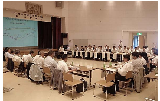
北村地域連携調整会議「第1回幹事会」の様子

日時：平成26年6月26日（木）14:00～16:00 場所：岩見沢市北村環境改善センター 多目的ホール 参加者数：幹事他56名（幹事33名）