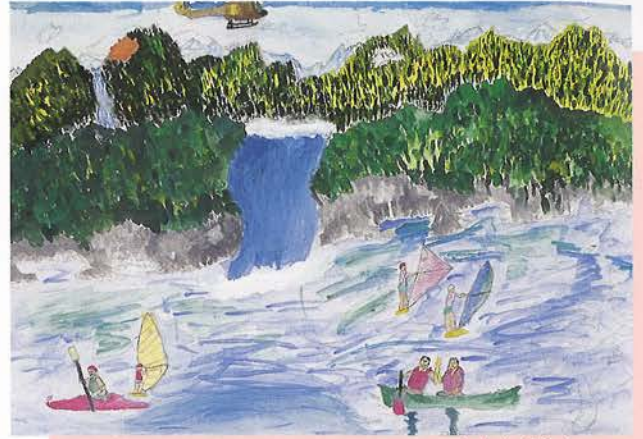
6年生 中村 健太くん