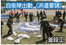
自衛隊出動 (派遣要請)