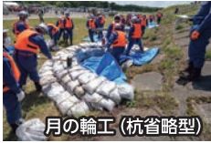
月の輪工 (杭省略型)