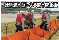
連続遊水壁による越水防止工