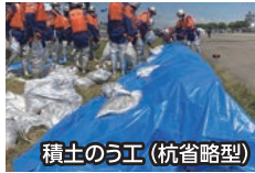
積土のう工 (杭省略型)