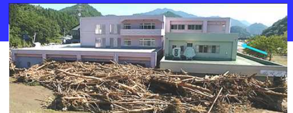
平成28年台風10号により、岩手県の要配慮者利用施設では利用者9名の全員が死