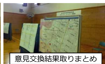
意見交換結果取りまとめ