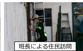
班長による住民訪問