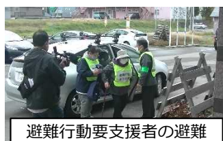
避難行動要支援者の避難