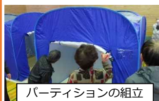
パーティションの組立