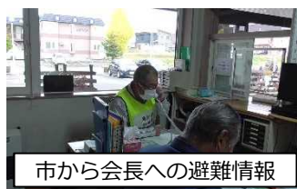
市から会長への避難情報

日時：10月29日（金）10:00～12:00 会場：（避難訓練）幸町第四区地区防災会のエリア内 （振り返り）幸町地区コミュニティセンター 参加者：幸町第四区地区防災会地域住民の方々（23名）