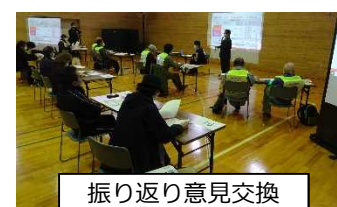
振り返り意見交換