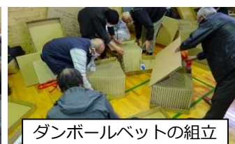
ダンボールベットの組立