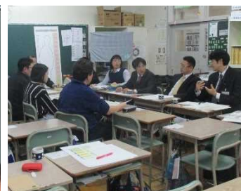
プロジェクトチーム会議