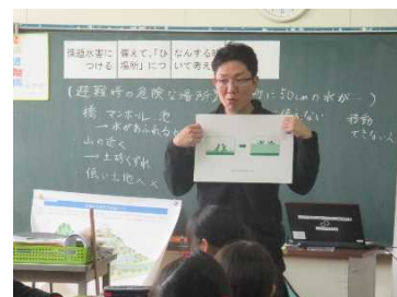
防災教育イラストを使用して学習