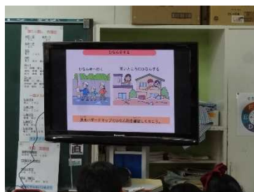
水害から命を守る行動について学習