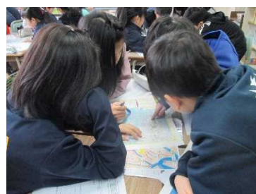
避難ルートについてグループで学習