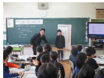
まさに水が流れ込んだら何が起きる？