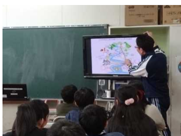
水害から暮らしを守る公共施設を学習