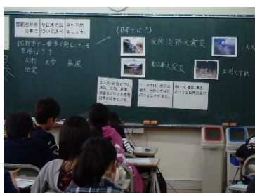
日本で発生した自然災害について学習