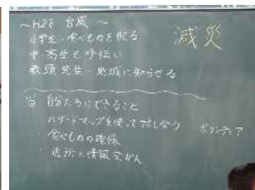
自分たちでできる防災行動を学習