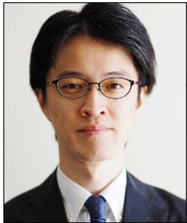
千歳川外部会長 千歳川河川事務所長