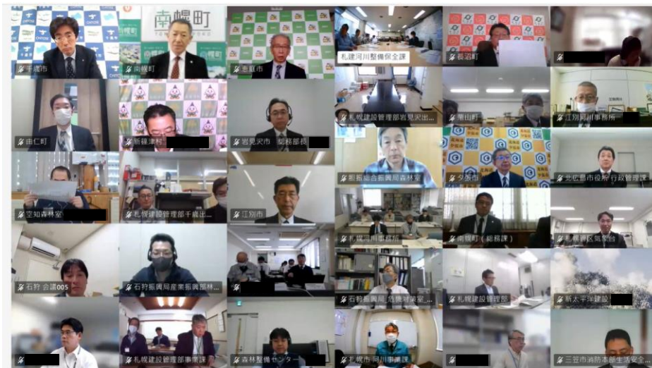
自治体等主な会場