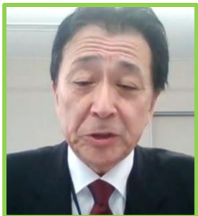
北広島市長 代理出席：副市長