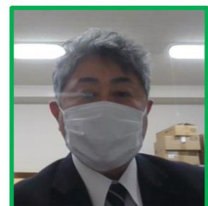
栗山町長 代理出席：総務課 参与