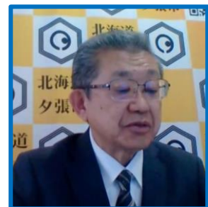
夕張市長 代理出席：副市長