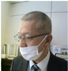
夕張川上流部会長 江別河川事務所長