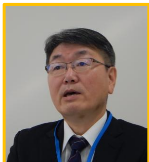
空知川地域部会長