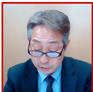
北竜町長 代理出席:副町長