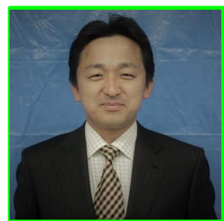
沼田町長 代理出席:建設課