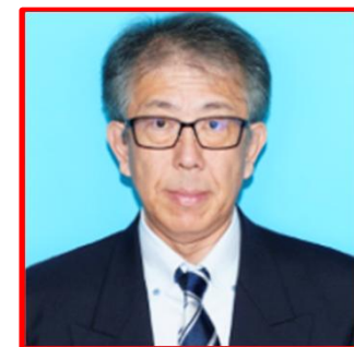
幌加内町長 代理出席:総務課