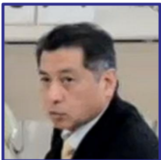
雨竜川外 地域部会長 滝川河川事務所長