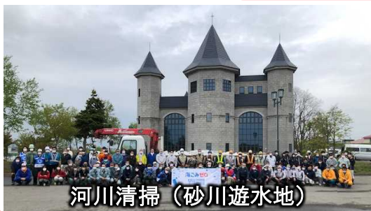
河川清掃（砂川遊水地）