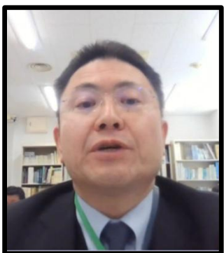
豊平川外地域部会長