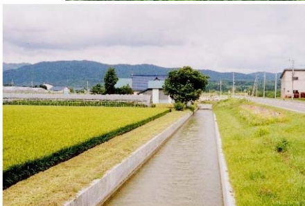
農業用水を通水するための用水路