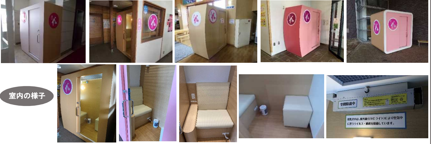
マオイの丘公園(屋外)