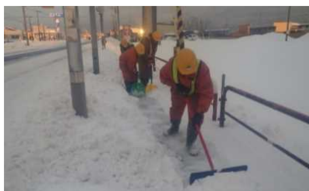
電柱の周辺は人力除雪となるため、効率が低下（国道36号 苫小牧市）