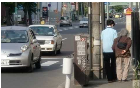
通行の障害（国道274号 札幌市）