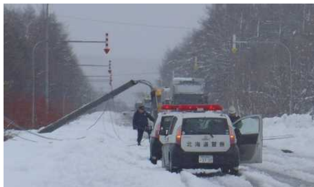
暴風雪による電柱の倒壊（国道336号 大樹町）