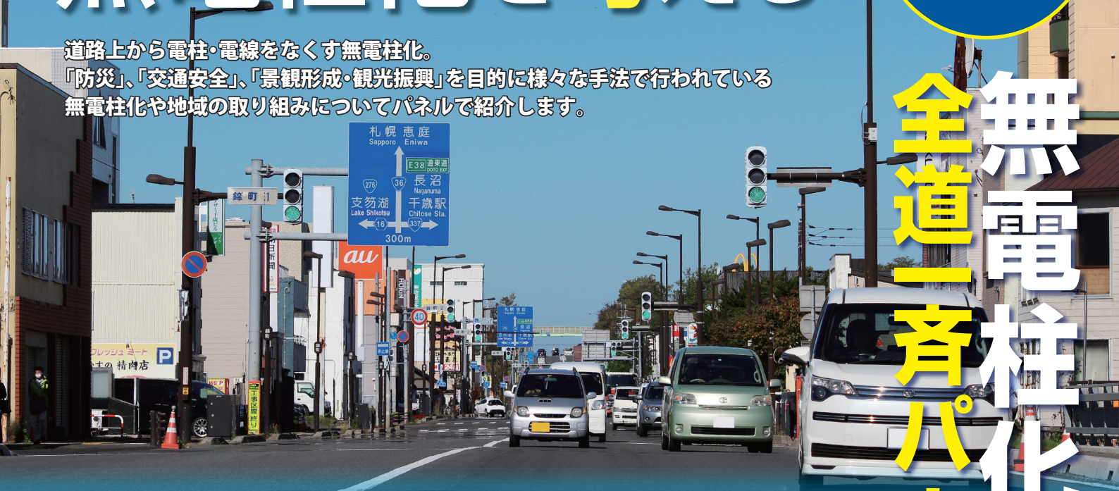
国道36号千歳市 千歳電線共同溝