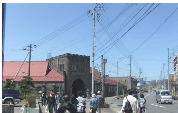
余市蒸留所前（国道229号 余市町）