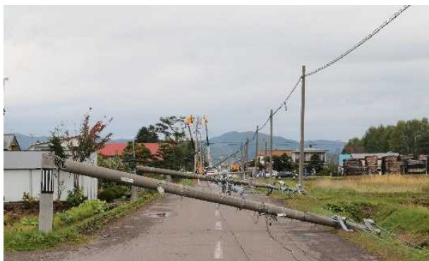
突風・飛来物による電柱の倒壊（東川町 町道）