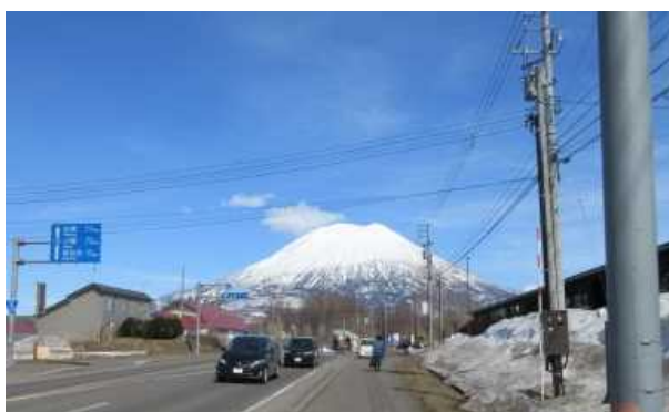
羊蹄山の眺望（国道5号 二セコ町）