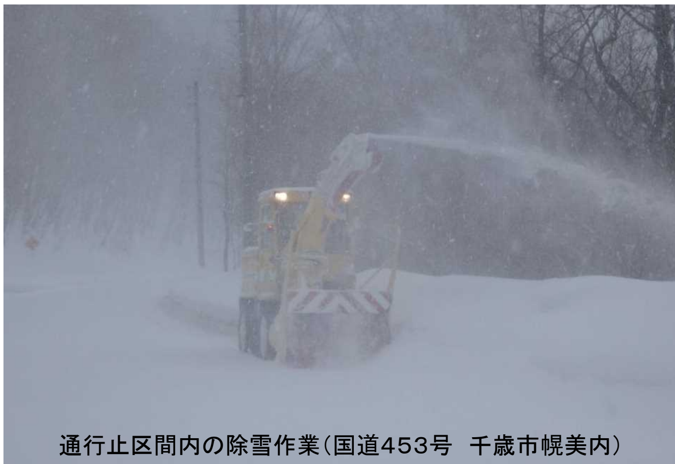
通行止区間内の除雪作業(国道453号 千歳市幌美内)