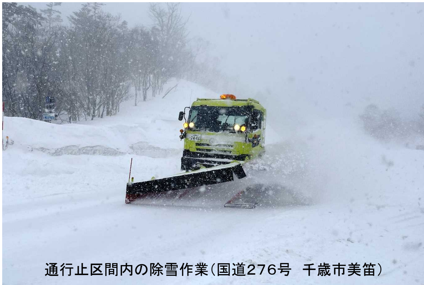
通行止区間内の除雪作業(国道276号 千歳市美笛)