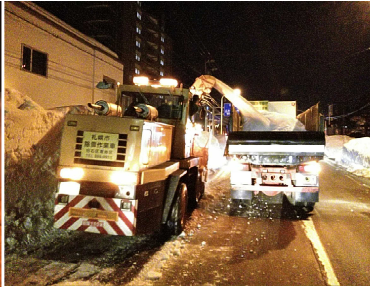
<除排雪作業実施状況>