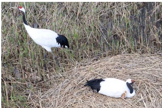
R4. 5. 14 撮影

同協議会のご意見も踏まえ、引き続き、舞鶴遊水地の一部の敷地への立入りを制限させていただいています。 タンチョウは警戒心が強い生きものであり、特に繁殖の時期は十分な距離をとる必要があります。 見学されるみなさまは、 鳥の駅マオイトーの周辺から優しく見守っていただきますようお願いいたします。