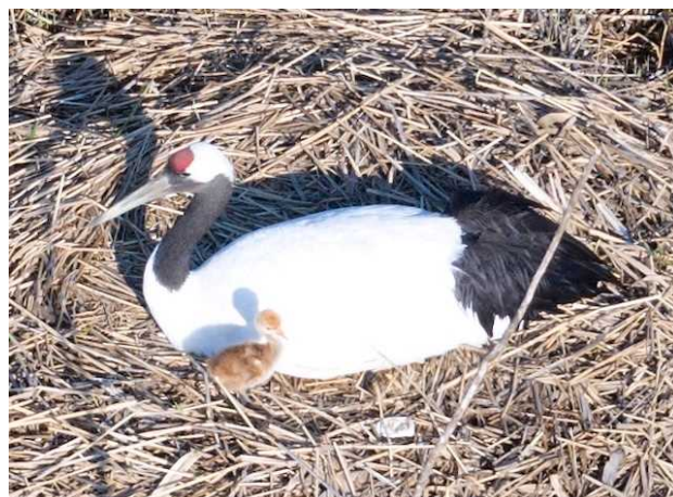
R4. 5. 16 撮影