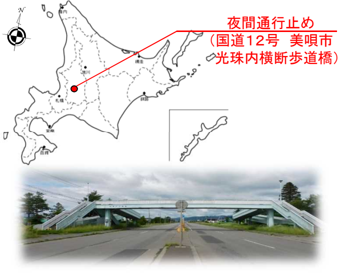
【横断歩道橋位置図】