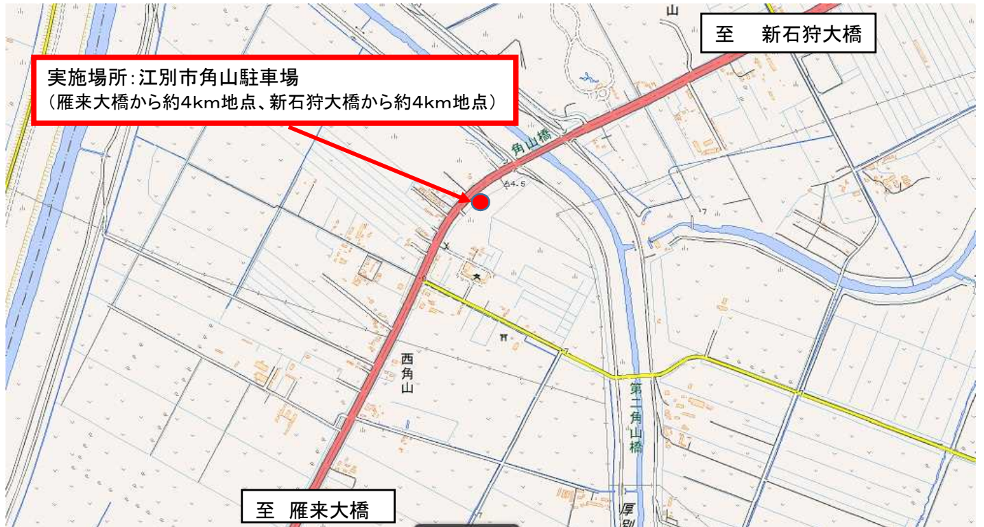
国土地理院地図 (電子国土Web)