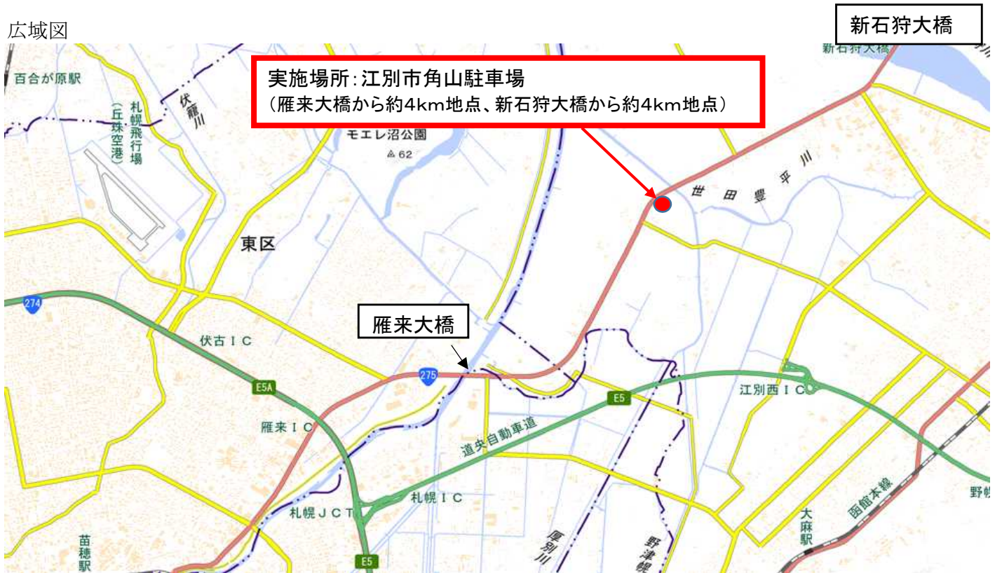
国土地理院地図 (電子国土Web)