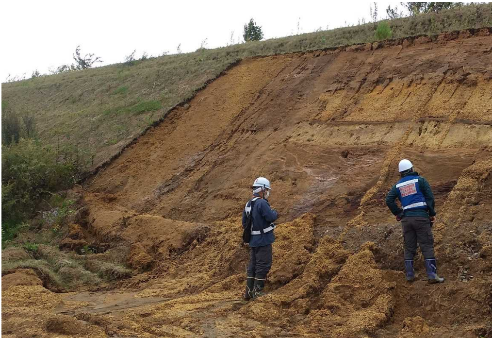
有識者による被災法面の点検