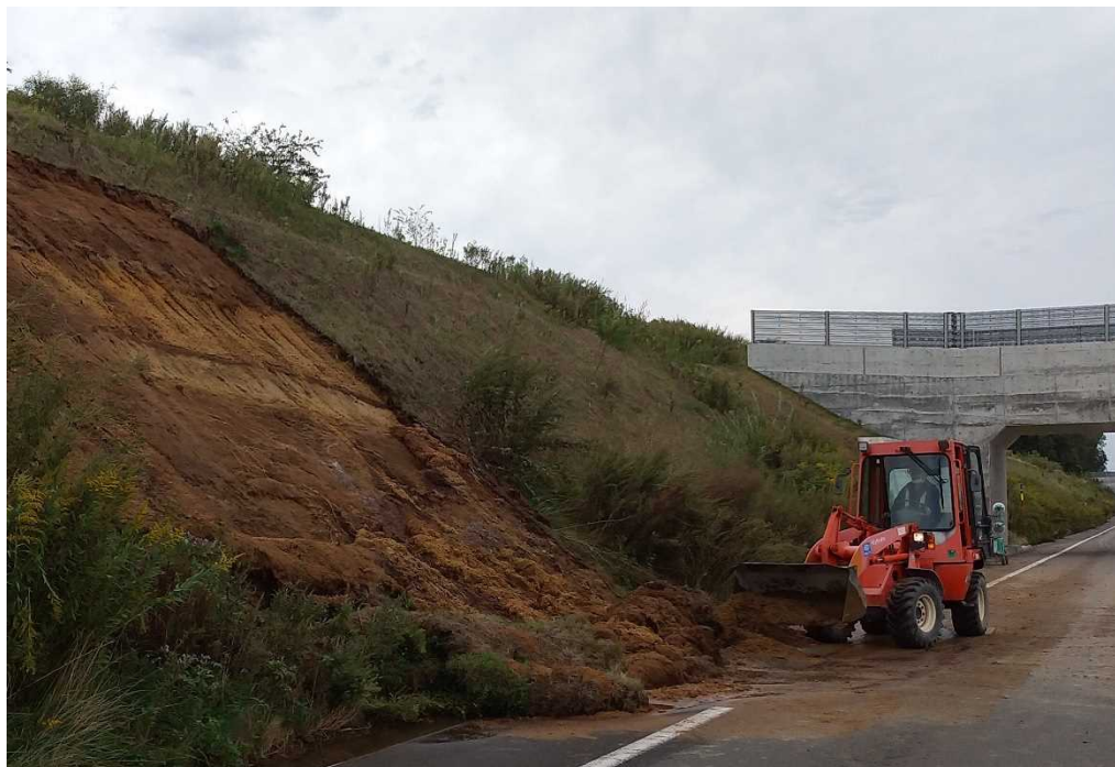
土砂撤去の作業状況