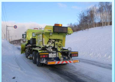
<凍結防止剤散布車>

氷板や圧雪アイスバーンなどのツルツル路面が発生する場合、凍結防止剤などを散布してツルツル路面の解消を図ります。凍結防止剤散布車により、交差点部などのツルツル路面において凍結防止剤（塩化ナトリウム等）や防滑材（砂）を散布します。