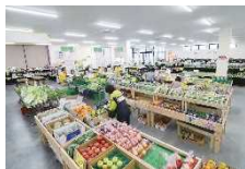
▲左:花ロードえにわ 右:農畜産物直売所かのな