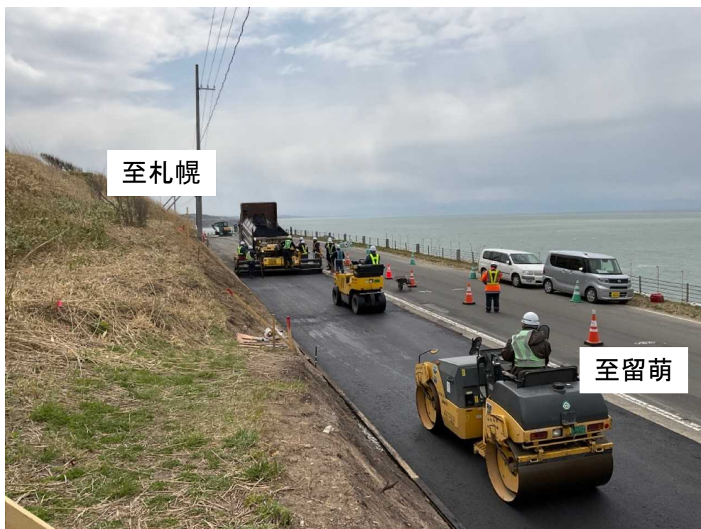
現地状況(仮道舗装)