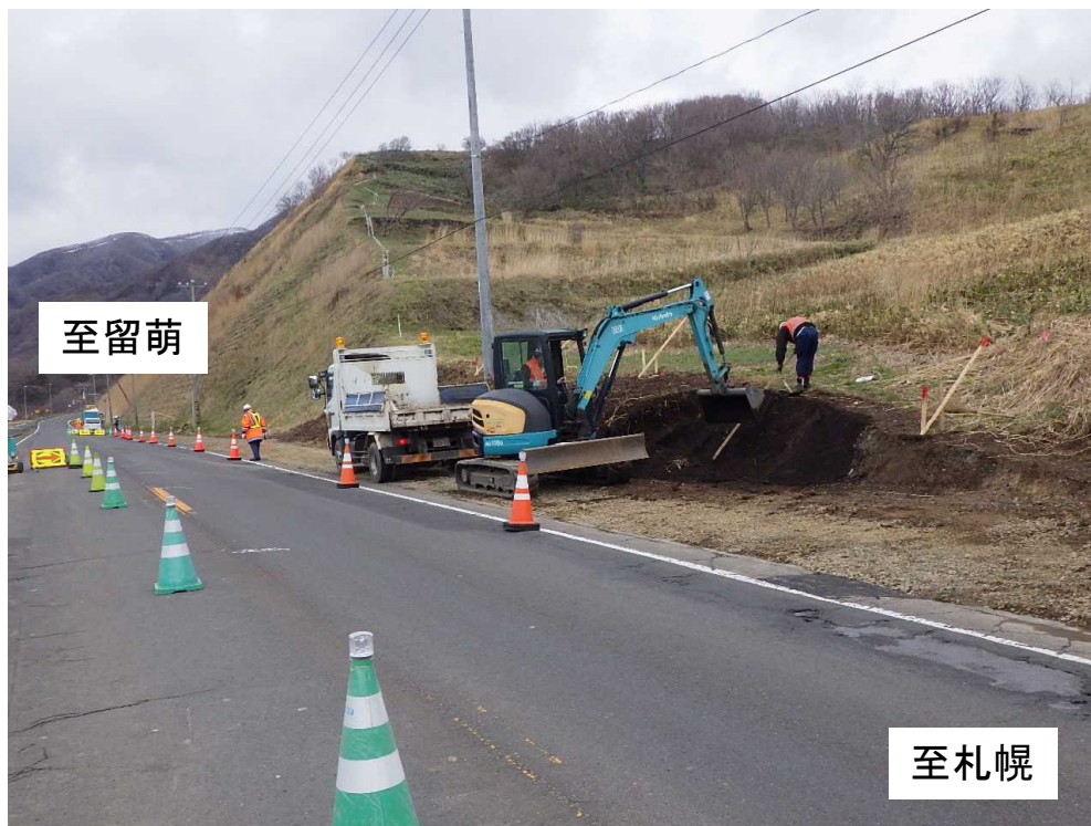
現地状況(仮道造成)