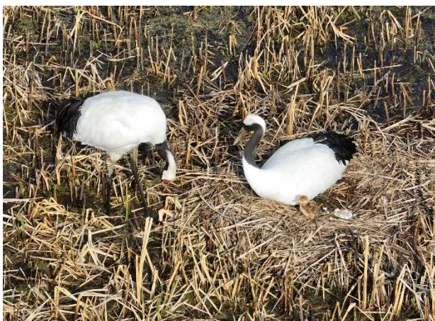
R5. 5. 5 撮影

同協議会のご意見も踏まえ、引き続き、舞鶴遊水地の一部の敷地への立ち入りを制限させていただきます。タンチョウに警戒心を起こさせないよう、特に繁殖の時期は十分な距離をとる必要があります。見学される皆さまは、鳥の駅マオイトーの周辺から優しく見守っていただきますようお願いいたします。