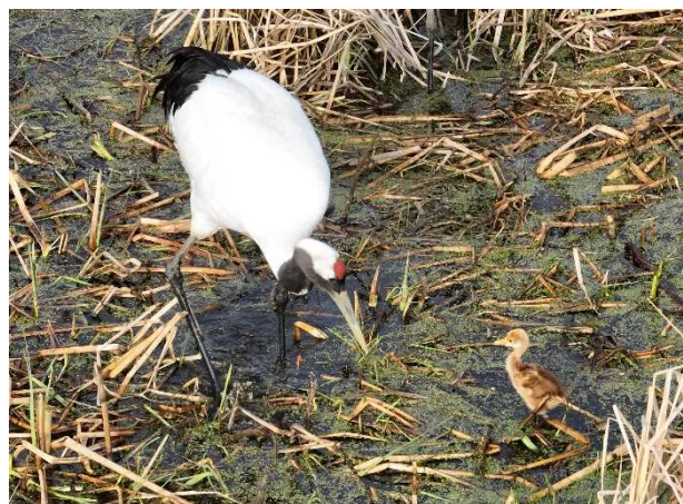
R5. 5. 11 撮影