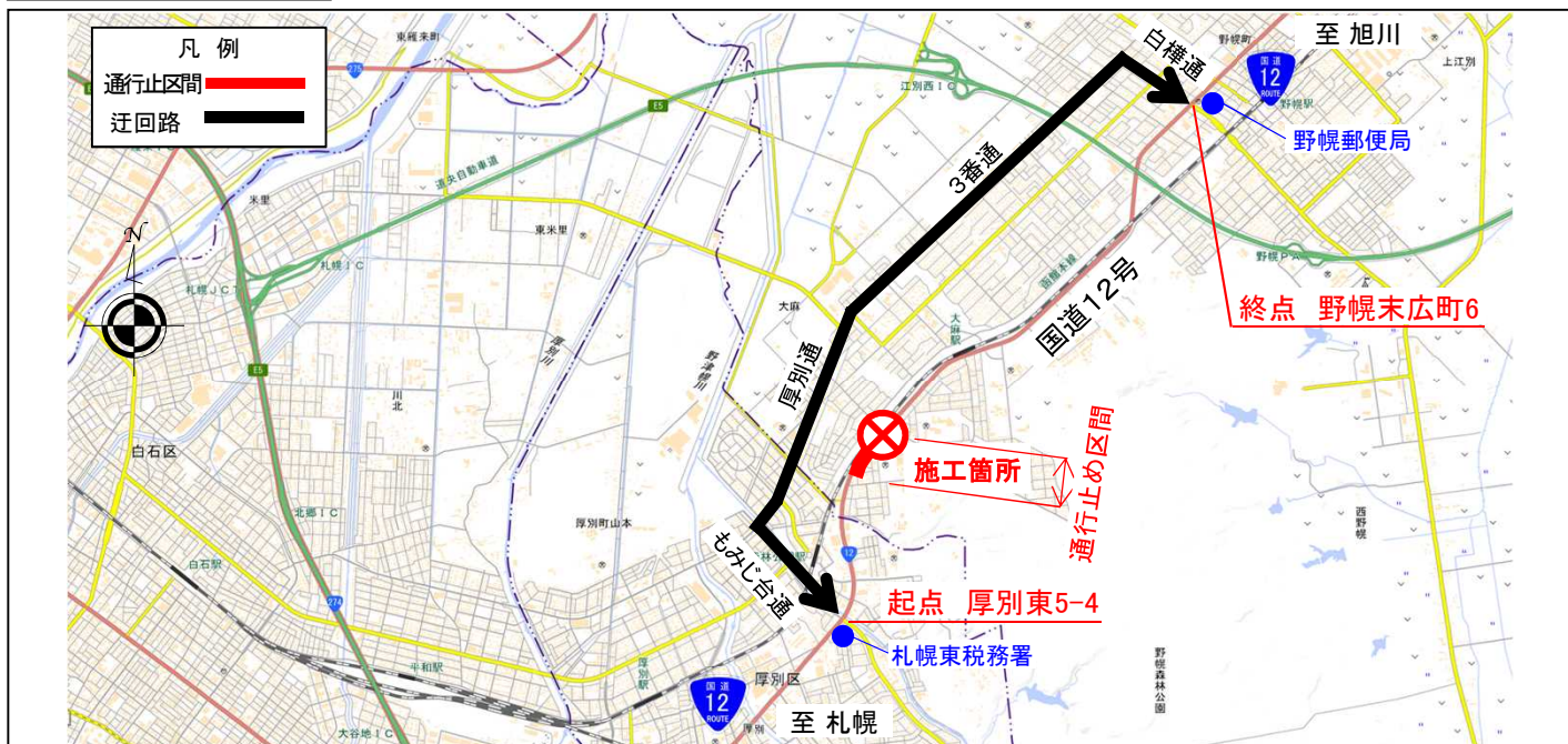
【迂回路】国道12号～もみじ台通～厚別通(道道864号)～3番通～白樺通～国道12号