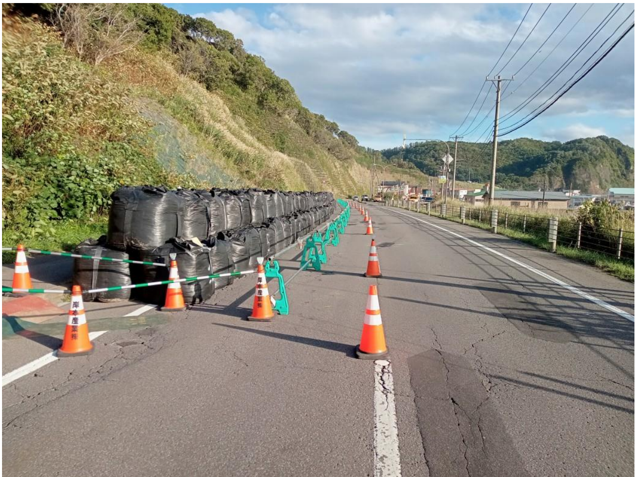
写真_9 / 20 大型土のう設置完了状況