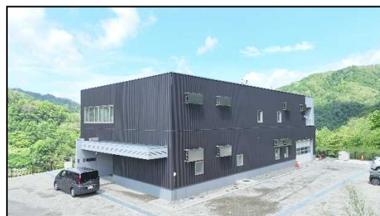
桂沢ダム管理支所（外観）