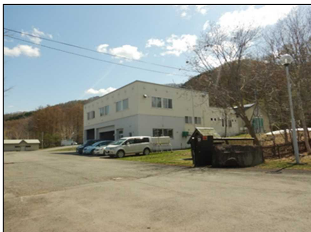
幾春別川ダム建設事業所（外観）