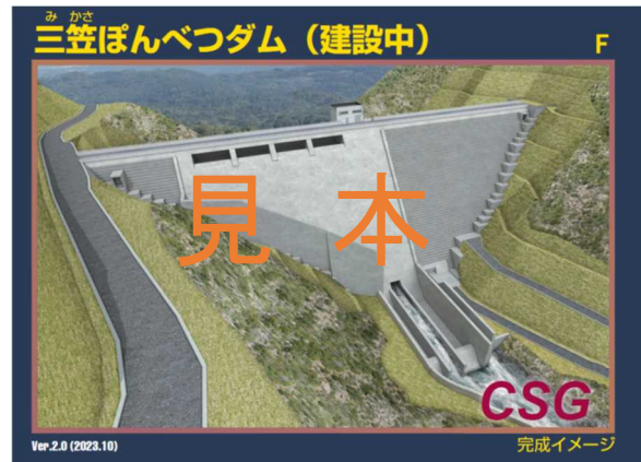
三笠ぽんべつダム（建設中）