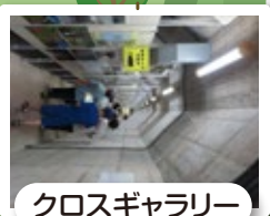
クロスギャラリー