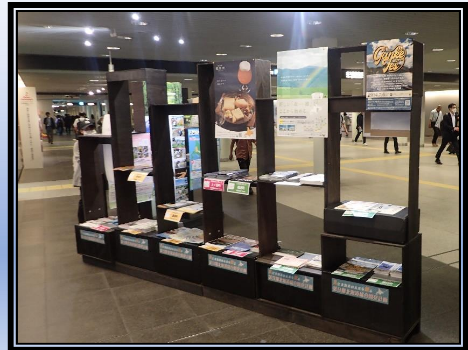
シェルフによる展示