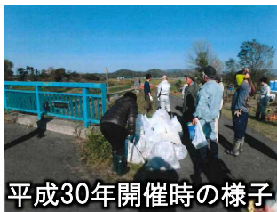
平成30年開催時の様子