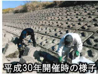
平成30年開催時の様子