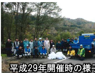
平成29年開催時の様子