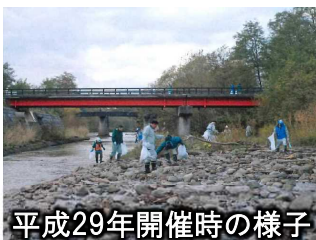
平成29年開催時の様子