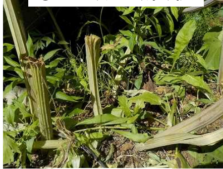
⑤フキが倒れた跡。食痕