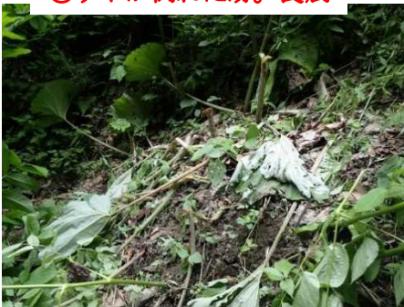
⑦ウドが倒れた跡。食痕