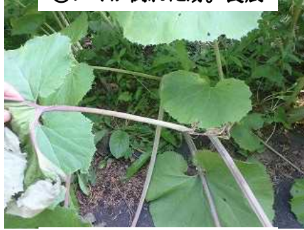
②フキが倒れた跡。食痕