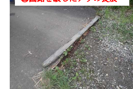
⑫園路を壊したアリの食痕