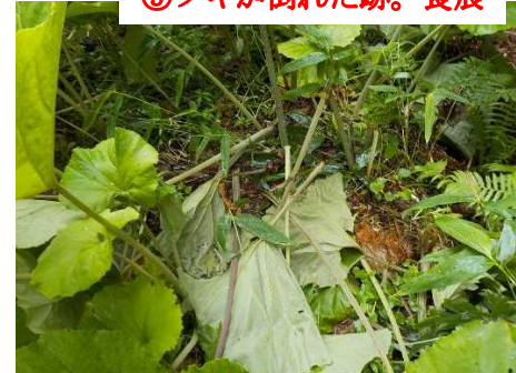
⑨フキが倒れた跡。食痕