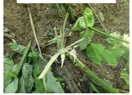
③ウドが倒れた跡。食痕