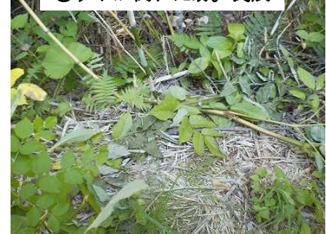
⑥ウドが倒れた跡。食痕