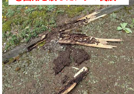
⑩園路を壊したアリの食痕