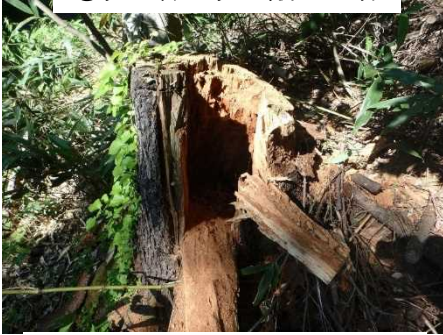
①切り株を切り崩した跡