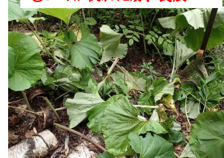
⑪フキが倒れた跡、食痕