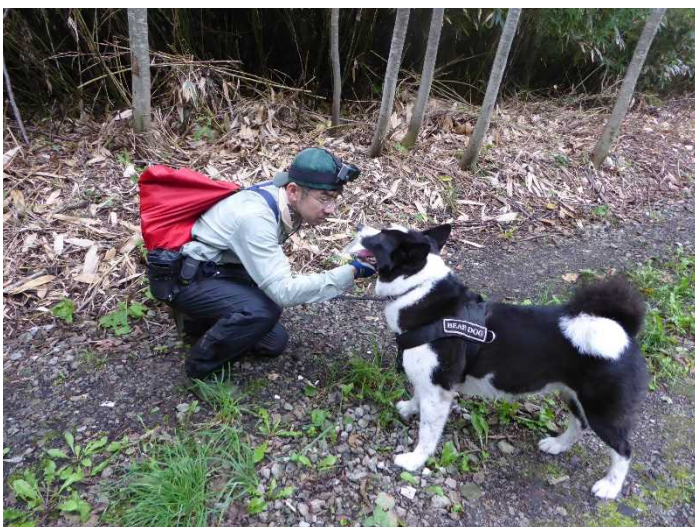
ベアドッグ確認状況①