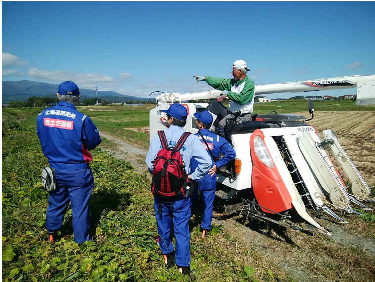
本宮市 百日側調査 (河川班)

地域の方から被災情報を収集し被災状況を調査、とりまとめた報告書は各自治体首長手交しました。