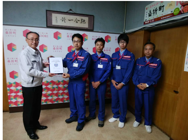
桑折町長への調査報告書手交 (河川班)