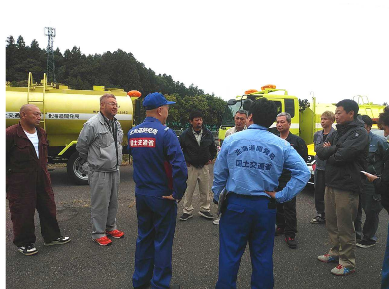
給水準備打合せ (丸森町で給水活動予定)