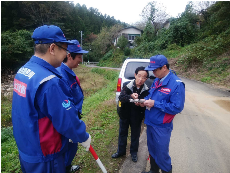
伊達市梅ノ木沢川被災状況 (道路班)