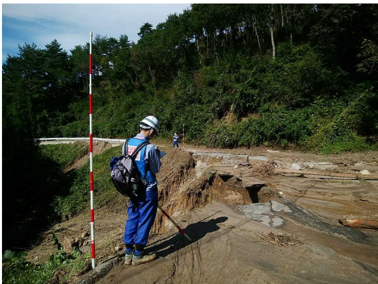
川俣町調査箇所 (砂防班)