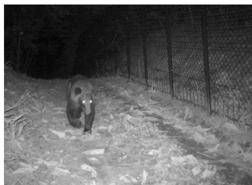
④ 熊(8/27 0:24 頃撮影)