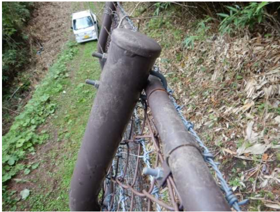
天端胴縁の泥の付着状況(熊の足跡)