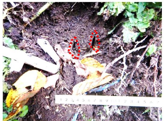
園外で確認した熊の足跡(爪跡(赤点線)を確認)