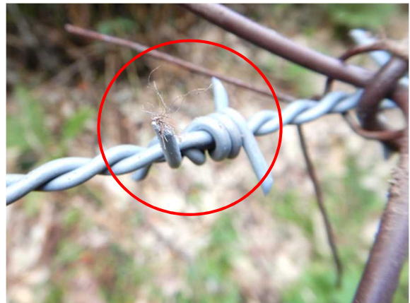
有刺鉄線に付着していた熊の被毛