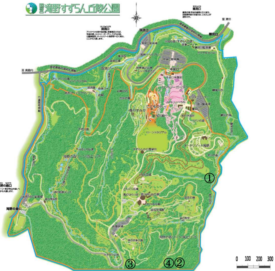
① 熊(8/26 23:17 頃撮影)