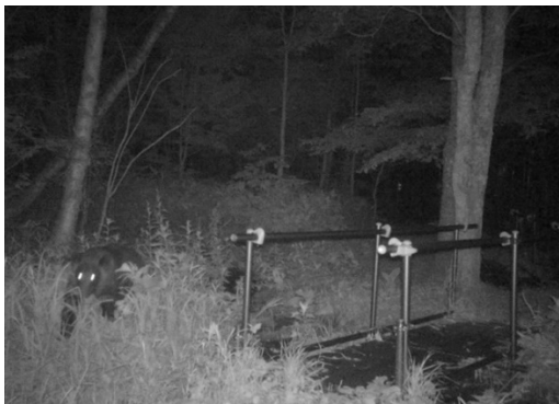
③ 熊(8/27 0:08 頃撮影)