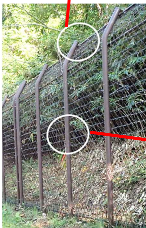
泥が付着していた支柱