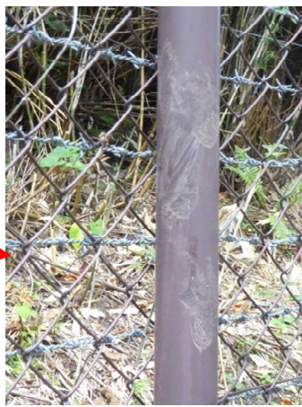
支柱に付着していた泥(熊の足跡)