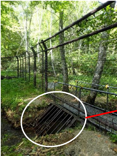
外周柵と沢の交差部のストレーナー①