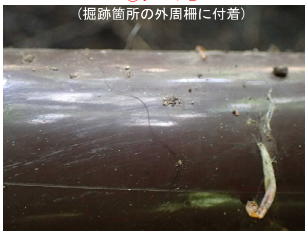
⑤クマの毛 (掘跡箇所の外周柵に付着)