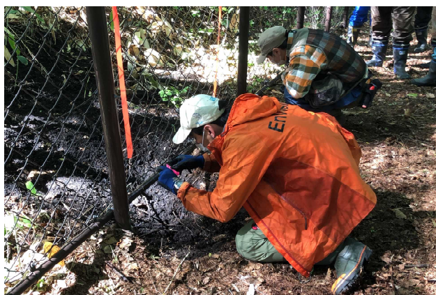
専門家による現地調査-1 (掘跡箇所)