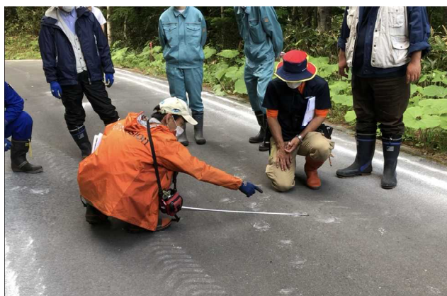
専門家による現地調査-2 (足跡箇所)