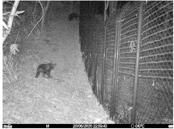
②熊(親子) 6/20 22:59