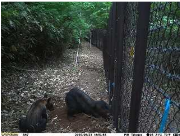
⑦外周柵の下を掘っている様子 6/23 18:53