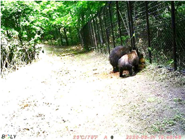
③穴を掘る親子熊 6/21 10:48