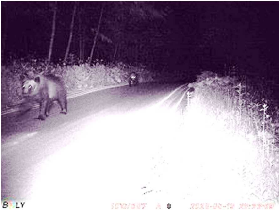
①熊(親子) 6/19 20:33