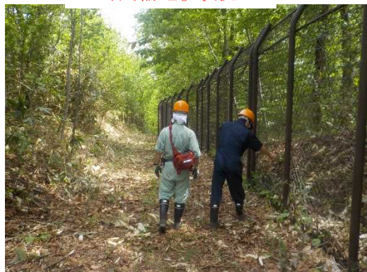
・ 外周柵巡視状況