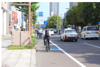
<路面表示設置状況>