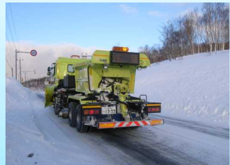
<凍結防止剤散布車>

凍結防止剤散布車により、交差点部などのツルツル路面において凍結防止剤（塩化ナトリウム等）や防滑材（砂）を散布します。