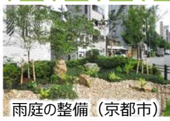
雨庭の整備（京都市）