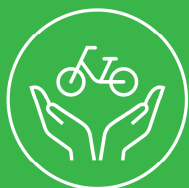
安全で安心な社会

日本は、自転車交通の役割をもっと大きく広げていきます。 安全・快適に自転車を活用できる環境を実現することにより、 安心な社会や地域の移動環境、観光地域づくりや健康長寿など、 人と地域が調和した豊かに暮らせる持続可能な社会を目指します。