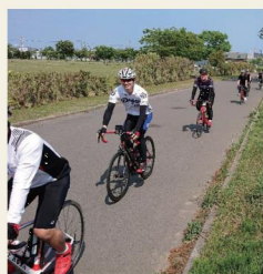
TOUR OF KAMUI 2022 石狩大会