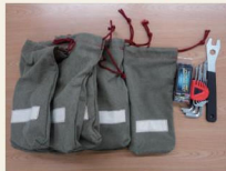
簡易な自転車修理キット