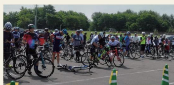
100km サイクリング in 旭川

プロモーション動画を作成し、YouTubeで広く国内外のサイクリストにPRしています。