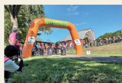
そらちグルメフォンド