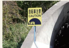
トンネル前の注意喚起看板