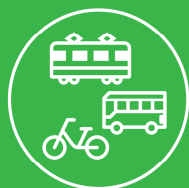
地域の良好な移動環境