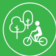
健康長寿や脱炭素