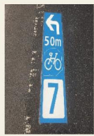
路面表示による案内