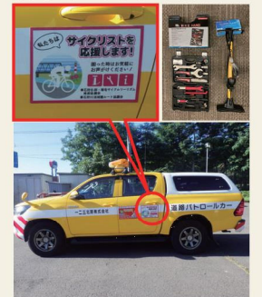
サイクリスト応援カー

道路や河川を管理するパトロールカーに、空気入れと修理工具を積み込み、サイクリストに無償で貸し出す『サイクリスト応援カー』の取り組みをスタートしています。