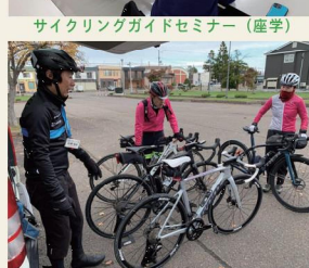
サイクリングガイドセミナー(実地)