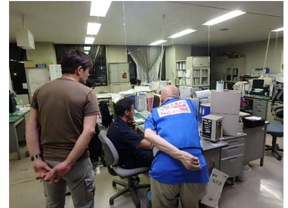
赤平市役所での活動の様子