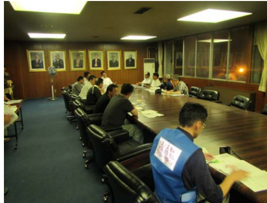
美唄市役所での活動の様子