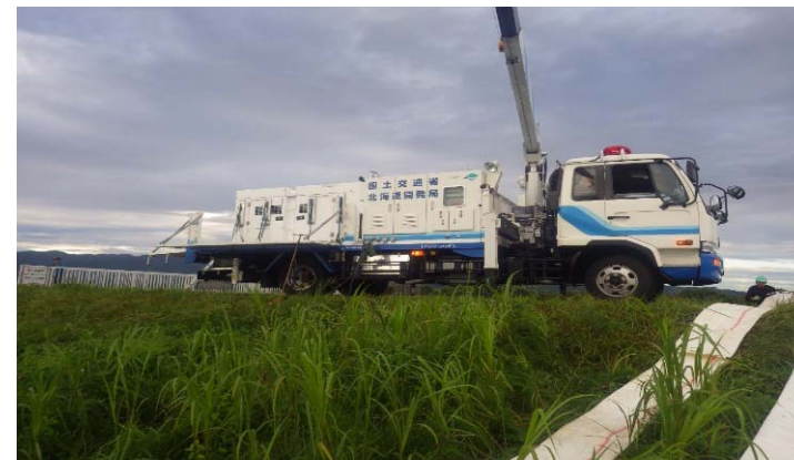
西中島樋門(妹背牛町)での排水ポンプ車作業状況