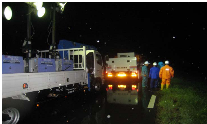
豊沼1号樋門(砂川市)での排水ポンプ車作業状況