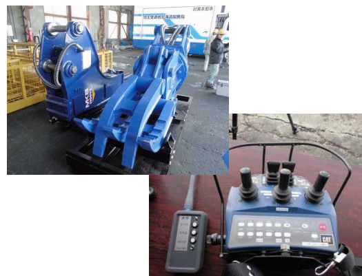
各種アタッチメント（グラブ、ブ レーカー）とコントローラー