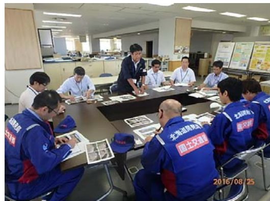
美瑛町役場の担当者と打合せの様子①