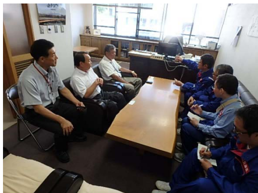
愛別町役場の町長室での挨拶の様子