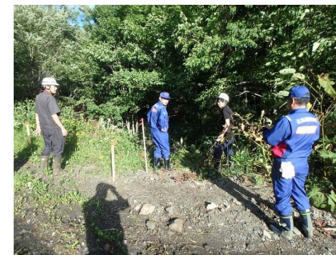
町道(愛別町)の現地踏査状況②