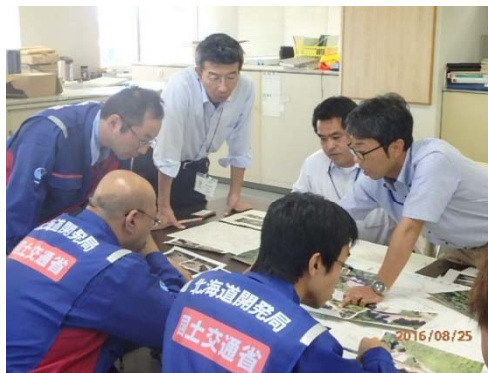
美瑛町役場の担当者と打合せの様子②