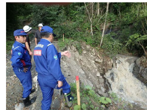
町道(愛別町)の現地踏査状況①