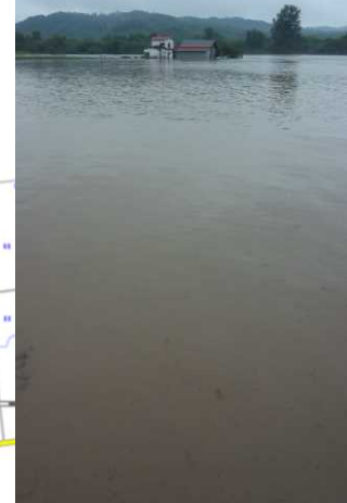
石狩川溢水状況 (旭川市神居町神居古潭)