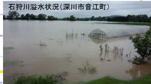
石狩川溢水状況(深川市音江町)