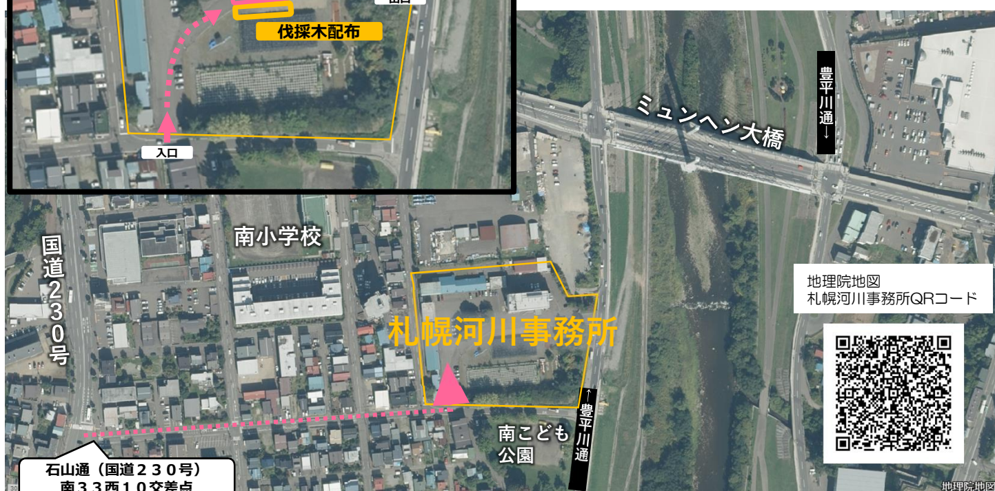
図2 札幌河川事務所 伐採木配布会場