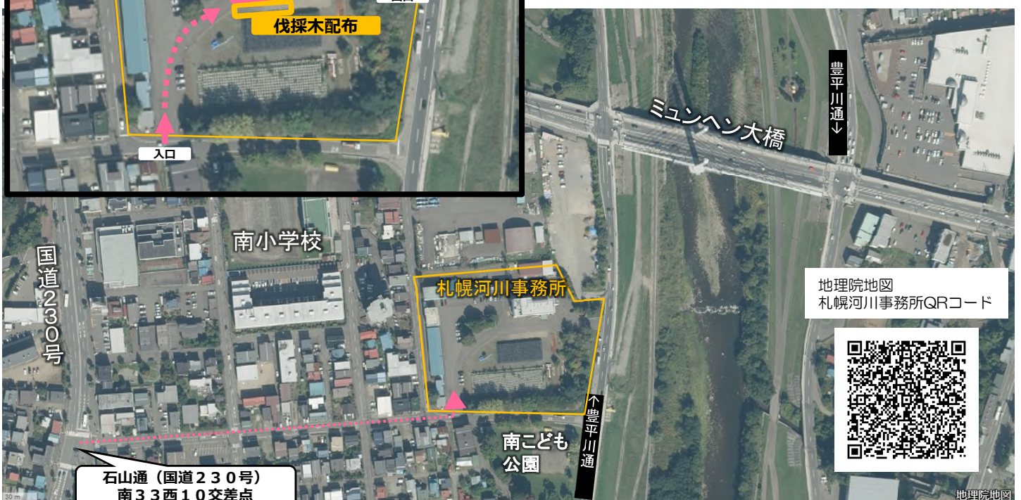
図2 札幌河川事務所 伐採木配布会場