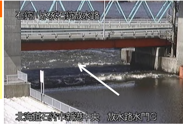
石狩放水路水門 放流状況