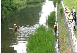
川の深さは場所によって急変し、見た目では分かりません。