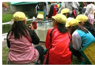
創成川に生息する魚等をパネルで学び、実際に捕獲した魚や水生昆虫を観察しました。