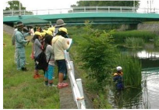
水草の茂っている箇所は水の中が見えにくくなっています。