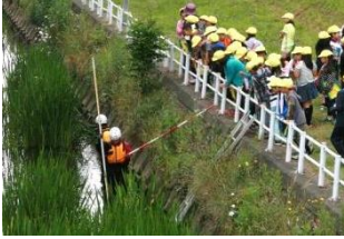
川岸の高い箇所やコンクリートの上は滑りやすいです。