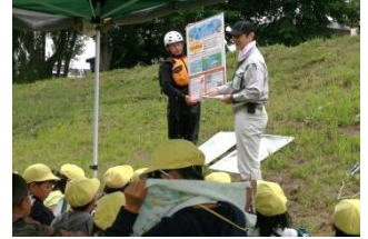
ルールを守って川の事故に注意しましょう。