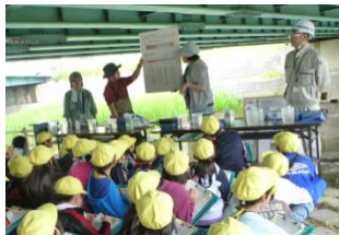
調べた結果から、川が「きれい」か、「よごれている」かのパネルを見て学習しました。