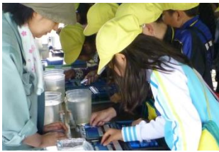
創成川と学校周辺を流れる川の水質を簡易測定キットを使って調べました。