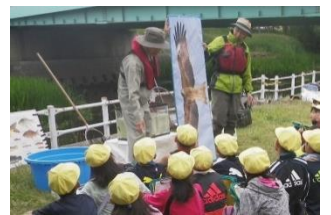
創成川周辺にいる鳥の種類や特徴をパネルで学び、鳥の鳴き声(CD)を聴きました。