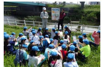
ルールを守って川の事故に注意しましょう。