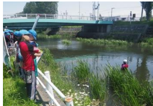
水草の茂っている箇所は水中が見えにくくなっています。