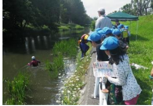
川の深さは場所によって急変し、見た目では分かりません。