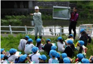
川には色々な危険箇所があることをパネルで学びました。