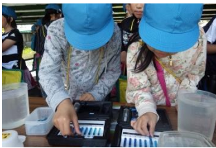
創成川と学校周辺を流れる川の水質を簡易測定キットを使って調べました。