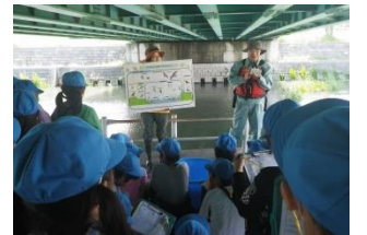
創成川周辺にいる鳥の種類や特徴をパネルで学び、鳴き声（CD）を聴きました。