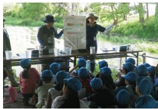
調べた結果から、川が「きれい」か「よごれている」のかパネルを見て学習しました。