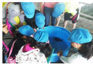
創成川に棲む生物をパネルで学び、実際に捕獲した魚類を観察しました。